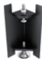
PODSTAWA POD WKŁAD