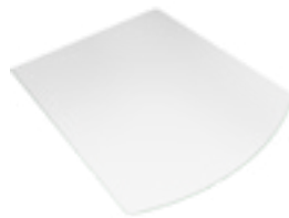
PODSTAWA SZKLANA MADRIT